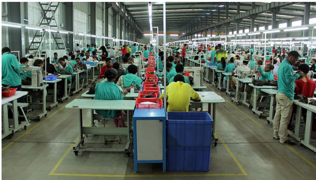
Afrika dankt China: Äthiopier arbeiten für den chinesischen Schuhproduzenten Huajian Shoes.

Jean-Pierre Kapp, Addis Abeba 14.10.2014, 05:30 Uhr